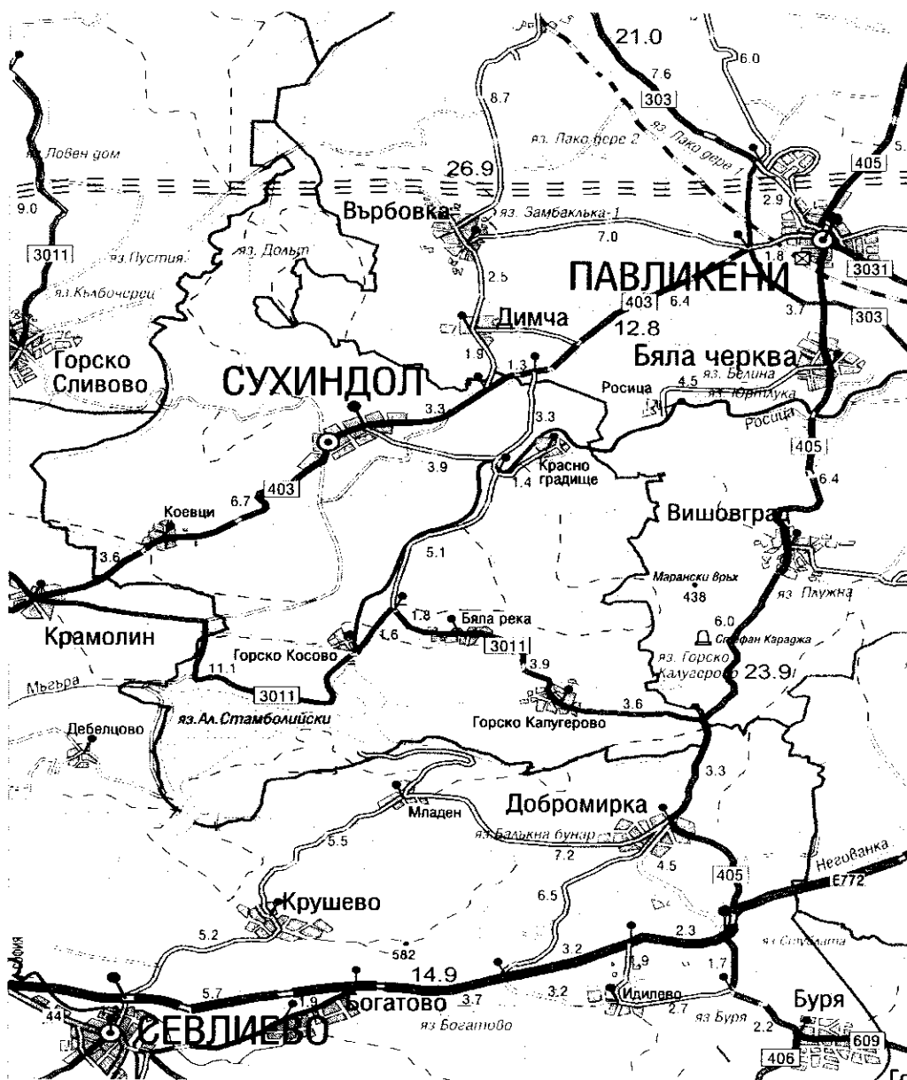
Фиг.1 Карта на община Сухиндол

Релеф: Релефът на общината е предимно хълмист, като цялата ѝ територия ѝ условно попада в обсега на Средния Предбалкан. В пределите на общината попадат части от четири броя възвишения, височини и плата. Югоизточно от река Росица се намират северозападните части на платото Плужна с височина до 447 m. На юг от селата Бяла река и Горско Калугерово, източно от язовир „Александър Стамболийски“ попадат най-североизточните разклонения на Севлиевските височини – връх Градинката 507 m, разположен южно от село Горско Калугерово. Западната част на общината се заема от най-източните части на Деветашкото плато – връх Куклица 525 m, максималната височина на общината, разположен югозападно от село Коевци. Северно от общинския център Сухиндол се простира най-южната част на веригата от т.н. Базалтови могили – Върха (472 m)..