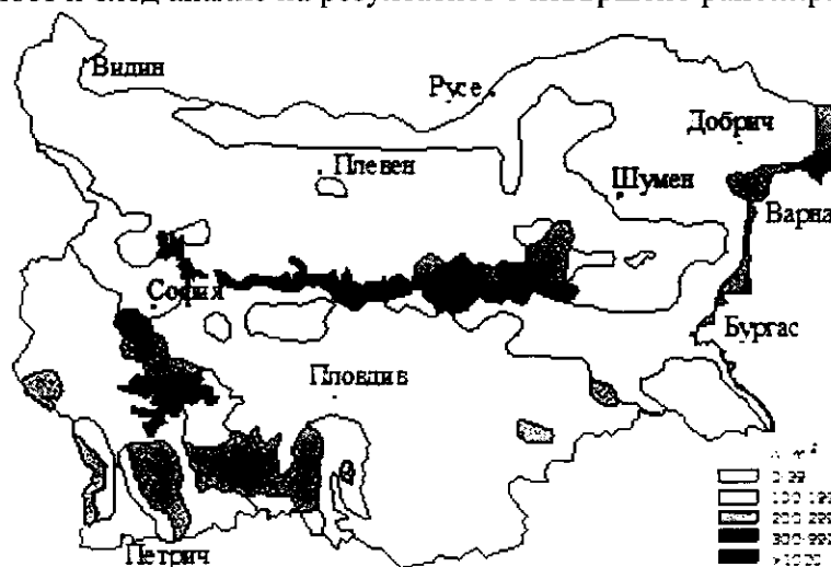
Фиг. 4. Картохема на плътността на енергията на вятъра на височина 10 m над земната повърхност.

За пълна оценка на енергийните качества на вятъра е анализирана плътността на въздуха и турбулентността в около 800 точки от страната. Направени са измервания на височина 10 m над земната повърхност и след анализ на резултатите е извършено райониране - Фиг.4.